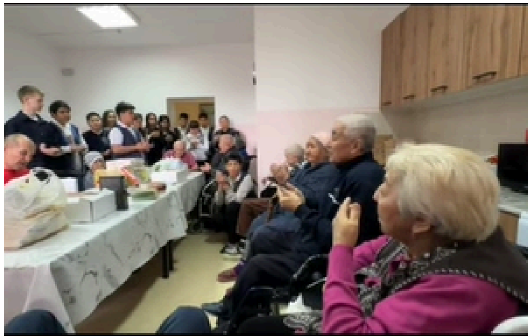
“ШАРАПАТ” ҚАРТТАР ҮЙІНДЕ ҚАЙЫРЫМДЫЛЫҚ АКЦИЯСЫН -ӨТКІЗУ