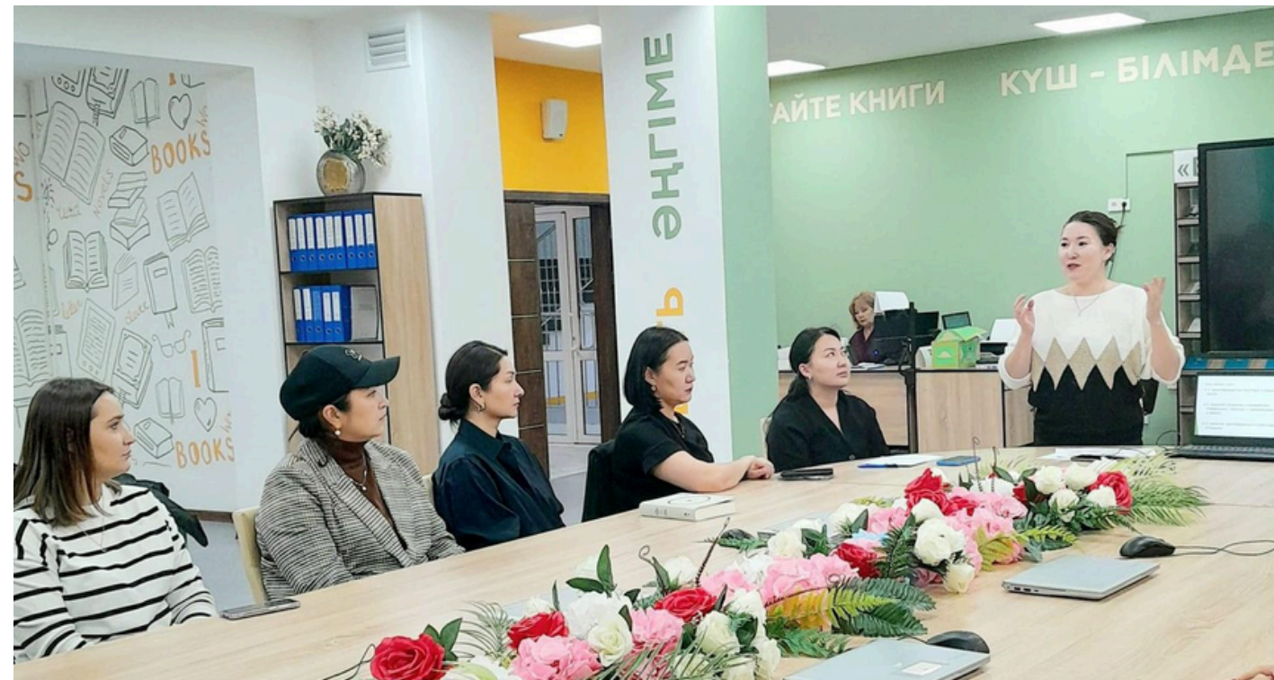
АТА-АНАЛАР ҚОЛДАУ ОРТАЛЫҒЫ

АТА-АНАЛАРМЕН ҮНТІМАҚТАСТЫҚ АТА-АНАЛАРМЕН АШЫҚ ЖӘНЕ ЖАҒЫМДЫ ҚАРЫМ-ҚАТЫНАСТЫ ДАМУ. МЕКТЕП ПЕН ОТБАСЫ АРАСЫНДАҒЫ БАЙЛАНЫСТЫ НЫҒАЙТУ ҮШІН АТА-АНАЛАРДЫ МЕКТЕП ӨМІРІНЕ ТАРТУ.