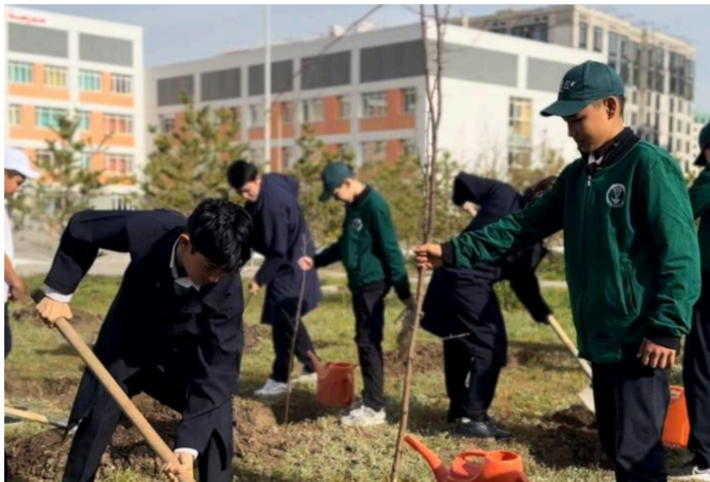
“ТАЗА ҚАЗАҚСТАН” АКЦИЯСЫН ӨТКІЗУ

Мектептегі өзін-өзі басқару ұйымының дербес таңдау жасауға, белсенді өмірлік ұстанымдары қалыптасқан қабілетті көшбасшы ретінде тәрбиелеу болып табылады.